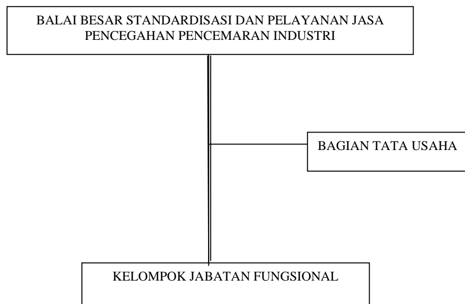
Gambar 1: Struktur Organisasi BBSPJPI

Struktur organisasi Balai Besar Standardisasi dan Pelayanan Jasa Pencegahan Pencemaran Industri sesuai Peraturan Menteri Perindustrian Nomor 1 Tahun 2022, sebagaimana bagan berikut: