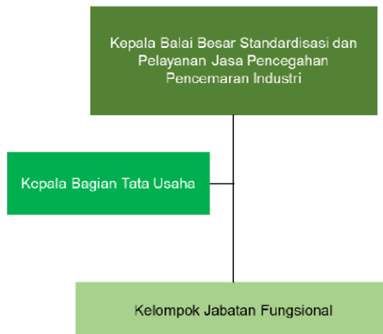
Gambar 2. Struktur Organisasi BBSPJPPI

Sementara itu, Kelompok Jabatan Fungsional mempunyai tugas memberikan pelayanan fungsional dalam pelaksanaan tugas dan fungsi unit pelaksana teknis di lingkungan BBSPJPPI sesuai dengan bidang keahlian dan keterampilan.