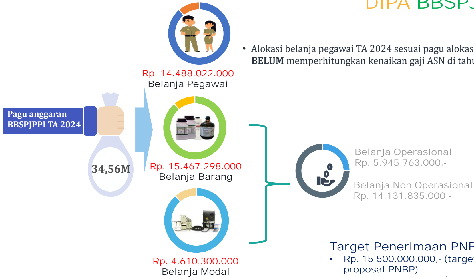
Komposisi Anggaran Per Jenis Belanja